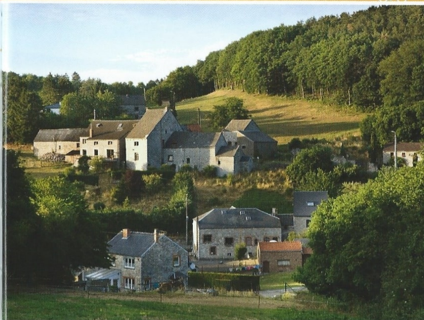
De kleur van de lokale blauwsteen bepaalt in grote mate het uitzicht van Thon.