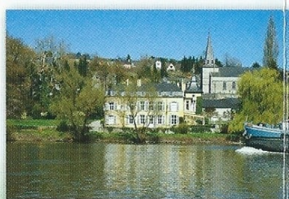
In Namêche vloeit de Samson in de Maas.