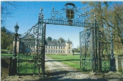
Het monumentale gietijzeren afsluithekken van het kasteel Haltinge was eigenlijk gemaakt voor het koninklijk kasteel van Ciergnon.