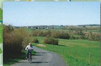
De omgeving van Coutisse.