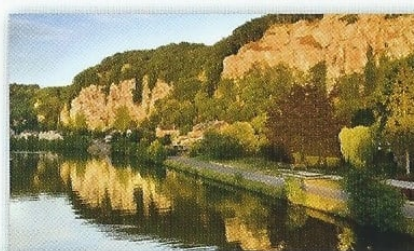
De meer dan 100 m hoge rotsen in de buurt van Thon bieden een schitterend uitzicht op de streek.