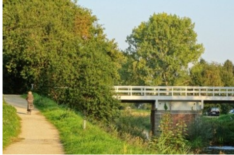
Korte tocht: 34,4 km

Parkeren: Op het marktplein van Westerlo.