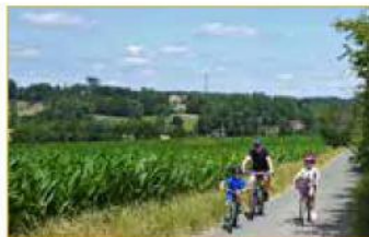
Het Ravel-fietspad loopt door het ongerepte Pays des Collines

Ellezelles: Maison du Parc Naturel du Pays des Collines , kn 84, (pays-des-collines.be), open 10 > 17.30u, ma gesl.