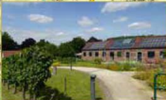
La Maison des Plantes Médicinales in Flobecq