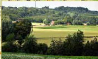
Uitkijkend op de Pottelberg (157 m) in La Houppe