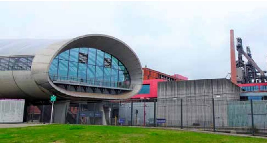
Het futuristische station van Belval-Universit .