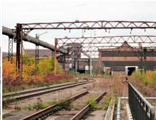
Vervallen site van Arcelor-Mittal.

trommelvliezen voortdurend gemarteld worden? Op de uitgestorven site van het vroegere staalbedrijf Arcelor-Mittal vind ik eindelijk rust. Ik kan gemakkelijk een spoorberm opklimmen. Boven wemelt het van spoorlijnen die vertrekken vanuit verroeste fabriekshallen. Vergane glorie alom. Spoorlopen is hier toegelaten en de stilte tussen de rails voelt onwezenlijk aan. Mijn tweede rustpunt is een stukje nat natuurgebied waar de Alzette haar weg in zoekt. Mijn groene onderdorpeling eindigt in een aangelegde kruidentuin en in 'Der Schifflinger Bongert', een boomgaard met oude appel- en perenrassen.