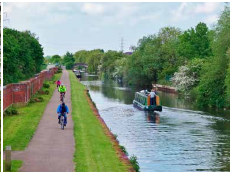
Langs het Nottingham Canal.

naar een plateau. Daar liggen langwerpige rotsstenen in een perfecte cirkel bijeen, met in het midden een reuzegrote platte steen. Ik herinner me nog dat Steve zich languit uitstrekte op deze voorhistorische steen, zijn armen ten hemel gericht. Ook ik richt een smeekbode tot de goden om op deze hoogte belbereik te krijgen, maar tevergeefs.