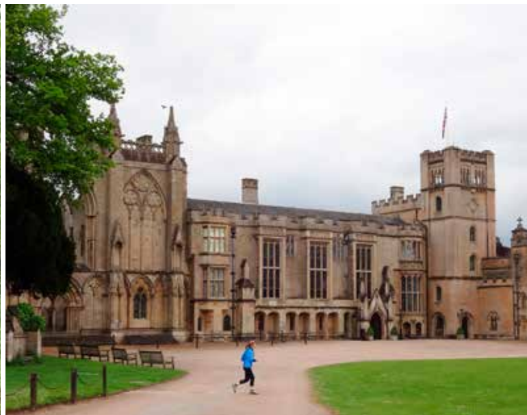
Newstead Abbey, een oude Augustijnerabdij.