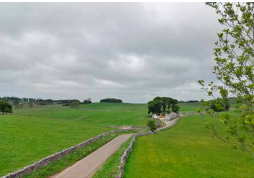
Groene, golvende bewegingen tot aan de horizon.