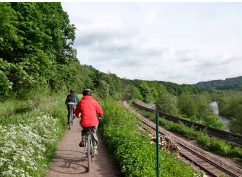
Jaagpad langs het Cromford Canal.