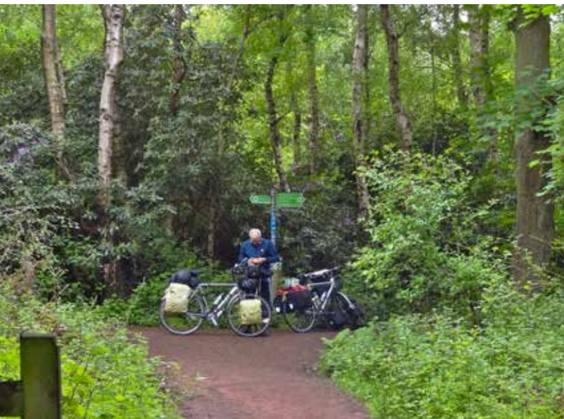
Sherwood Forest, thuis van Robin Hood.