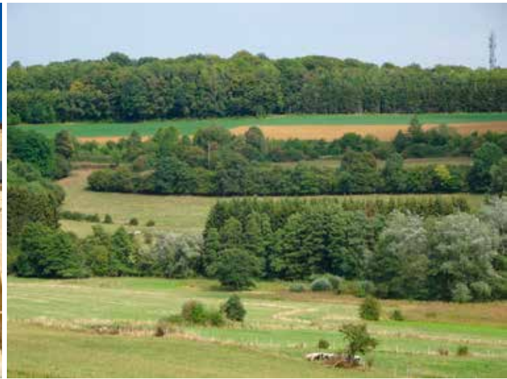
Op en neer golven in de buurt van Willancourt.