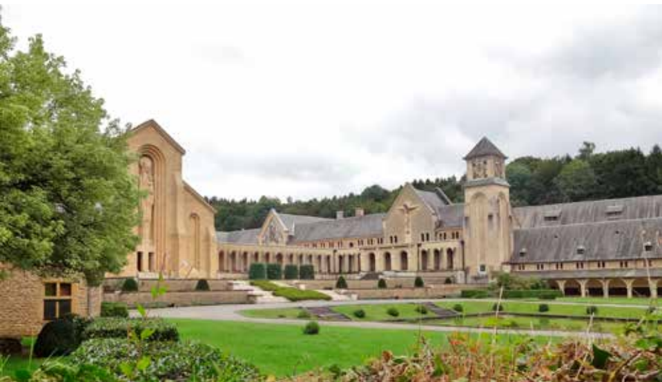
De abdijsite van Orval heeft veel meer te bieden dan trappistenbier.