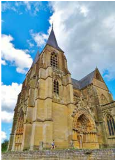
De kathedraal van Avioth.