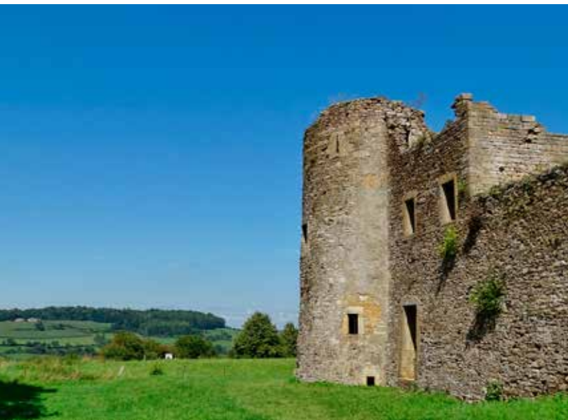
De laatste Gaumse versterkte burcht in Montquintin.