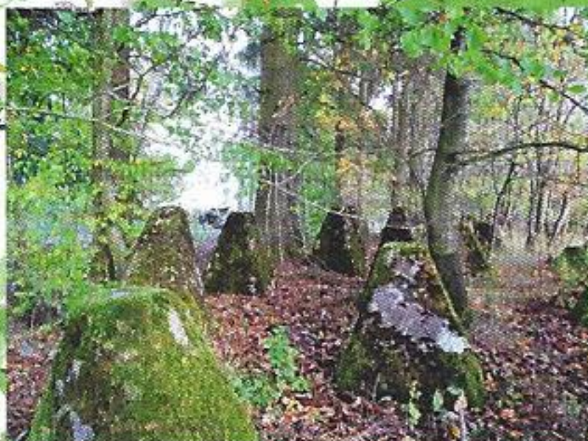
Drakentanden aan de grens