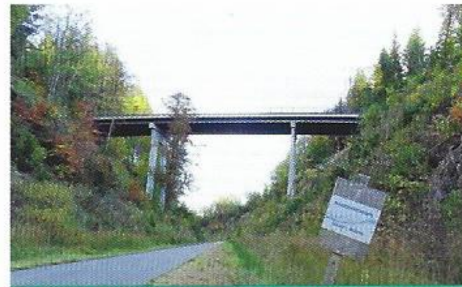
Waterscheidingspunt Maas-Rijn op de Vennquerbahn

De Weissen Stein is een grote plompe kiezelsteen op een zompige plek in het Bocksvenn vlakbij de Duitse grens. Het merkwaardig dat in dit waterzieke veen zo'n zware steen van 1m 3 te vinden is. Geologen hebben berekend dat hij ongeveer twee miljoen jaren geleden omhoog werd geduwd door de binnenste aardlagen en enige in de streek de erosie van de IJstijd overleefde. Door verwerking, algen en mossen heeft hij ondertussen een grauwe kleur gekregen. In de eerste eeuwen van onze tijdrekening was er nog geen sprake van geologie en werd dit rotsblok door de Kelten waarschijnlijk beschouwd als iets bovennatuurlijks dat aanbeden moest worden.