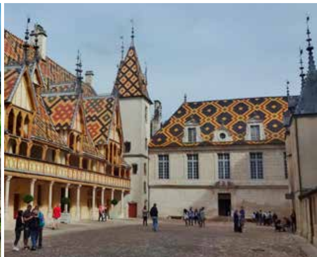
Het middeleeuwse hospitaal voor de armen in Beaune.