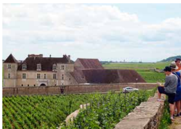
Het wijnkasteel van Vougeot.

Langs een snoer van wijndorpijjes volgen we de bordjes van de Route des Grands Crus richting Beaune , onze laatste cultuurstop. In het stadshart pronkt Les Hospices, een middeleeuwse liefdadigheidsinstelling uit 1443. Dit Hotel-Dieu was een hospitaal voor de armen dat pas rond 1960 zijn deuren sloot. Terug op straat werpen we een laatste blik op de daken van bontgekleurde geglaazuurde pannen, die zo typisch zijn voor de streek rond Dijon.