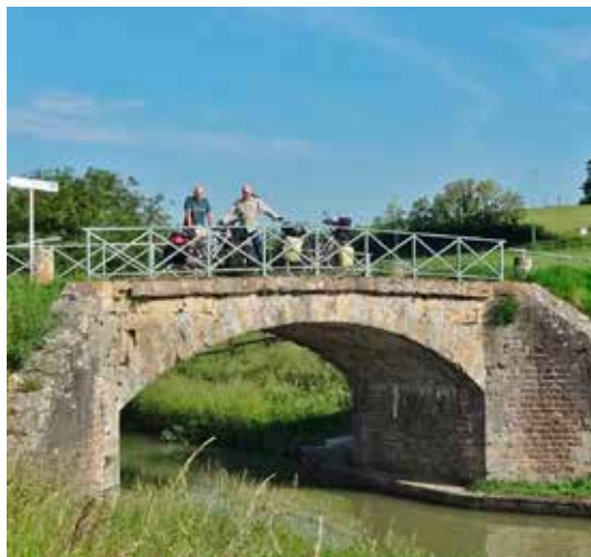
Andermaal een fotomoment langs het Canal du Nivernais.