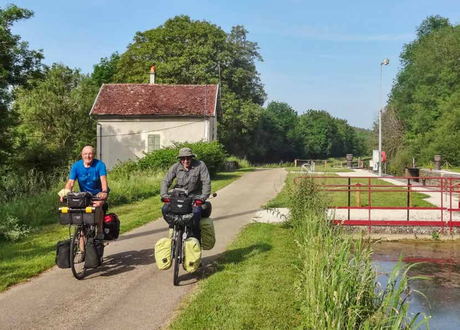
Langs het Canal du Nivernais.