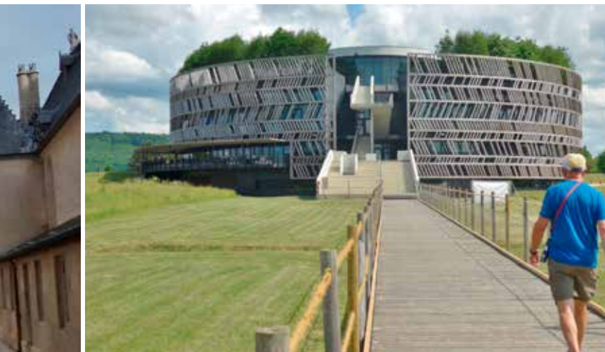
Hier vochten Caesar en Vercingétorix.