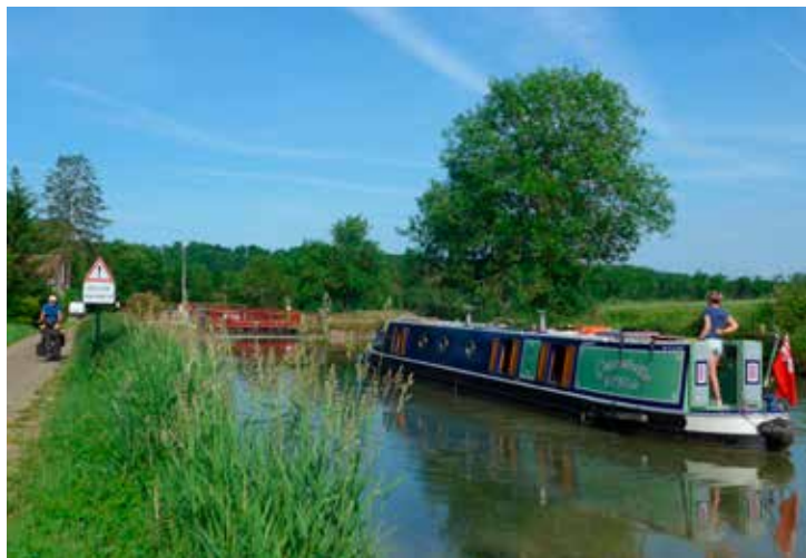
Pleziervaart op het Canal de Bourgogne.