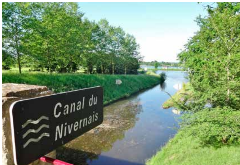
Het Canal du Nivernais heeft naast sluizen ook veel kronkels.