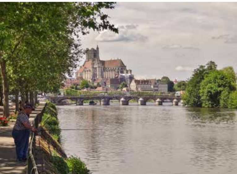
De kathedraal torent boven Auxerre uit.