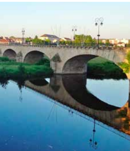
Decize aan de Loire.